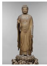
【阿弥陀如来像】 [奈良・東大寺]