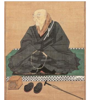
【国宝 親鸞聖人影像 (安城御影副本)】

聖人(親鸞)のつねの仰せには、「 弥陀の五劫思惟の願をよくよく案ずれば、ひとへに親鸞一人がためなりけり。されば、それほどの業をもちける身にてありけるを、たすけんとおぼしめしたちける本願のかたじけなさよ 」と御述懐候ひし・・・