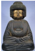
【五劫思惟阿弥陀如来坐像】 [奈良・五劫院]