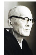
明治14年～昭和51年 明治～昭和期に活躍した 真宗大谷派僧侶、仏教思想家。大谷大学名誉教授

我々は和讃を主として初重・二重・三重の念仏を申すのであると思っておりましたが、そうでなく、勤行の場合には初重・二重・三重の念仏の方が主であつて、その念仏に添えて和讃を拝読するといふことなのでしょう。